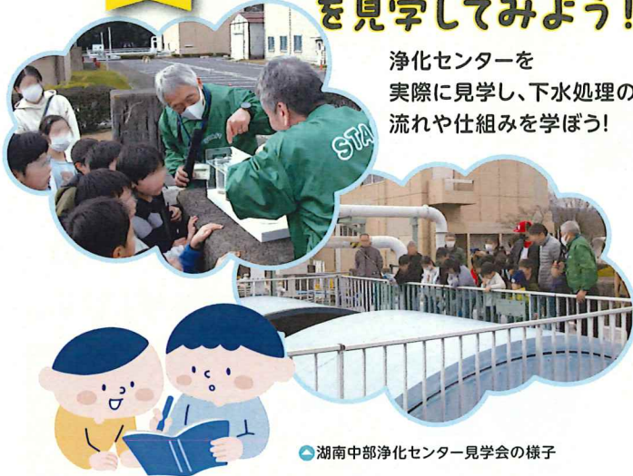
湖南中部浄化センター見学会の様子