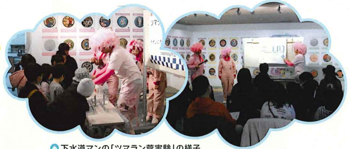
下水道マンの「ツマラン管実験」の様子