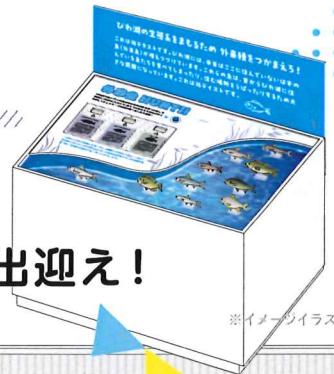
※イメージイラスト

2025年4月 [第2期 リニューアル工事]を終え より充実した“楽しく学べる展示”で皆さまをお出迎え!