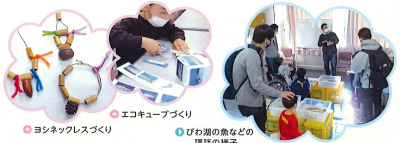
ヨシネックレスづくり

2/16 ▶ 「ヨシネックレスづくり」と「びわ湖の魚のはなし」 3/16 ▶ 「エコキューブづくり」と「びわ湖のいきものと水質の関係のはなし」